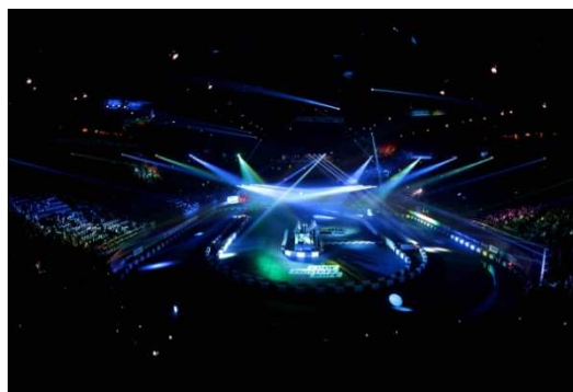
Les lumières du Palais Omnisports de Paris-Bercy