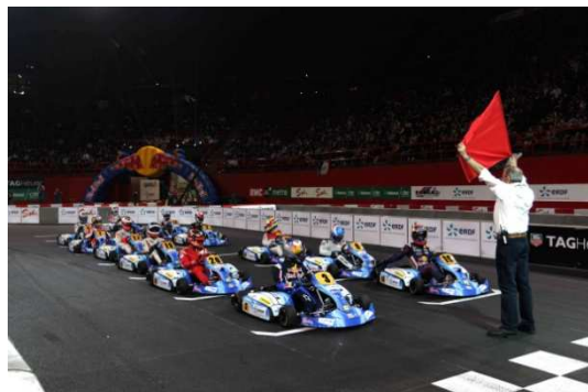
Départ plateau « Stars »